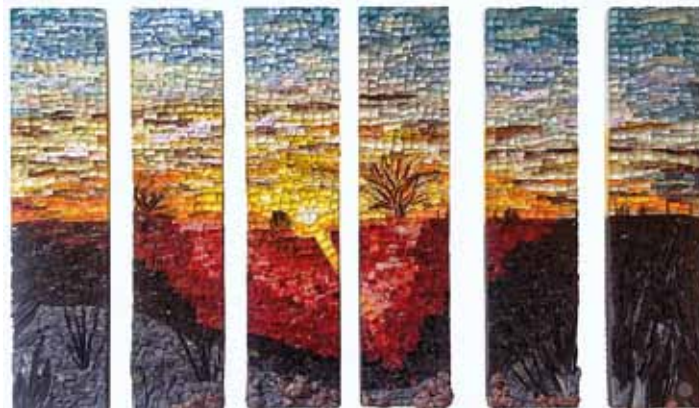
Sur la route. Chrystèle Albertini