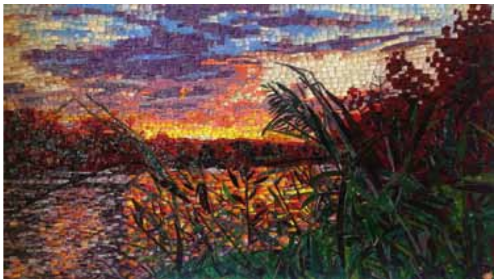
Jour de pêche. Chrystèle Albertini